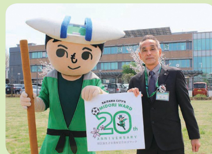
緑太郎と緑区役所前にて