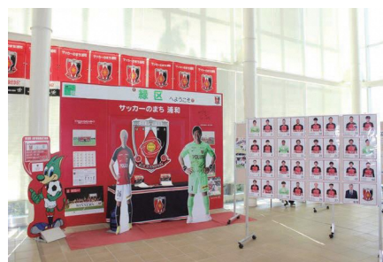
前回の浦和レッズ展の様子