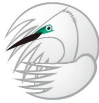
緑区の鳥 シラサギ