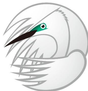
緑区の鳥 シラサギ