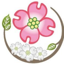
緑区の木 ハナミズキ