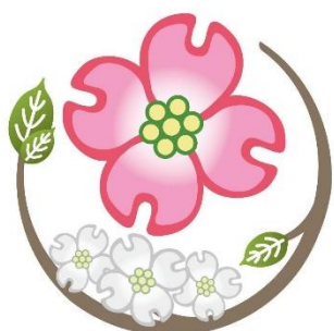
緑区の木 ハナミズキ