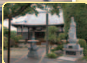
守光院 (南区太田窪 5-11-9) 建立：鎌倉時代 市指定有形文化財： 阿彌陀如来立像(本尊)