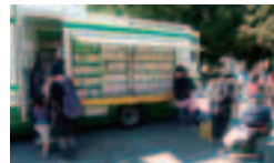
見沼区東大宮菖田島公園での様子

※移動図書館では、さいたま市図書館の利用者カードで資料を借りることができます。また、新しく利用者カードを作ることもできます。