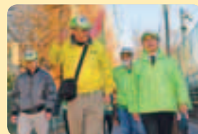
防犯パトロール統一行動