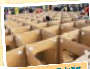
ダンボール巨大迷路