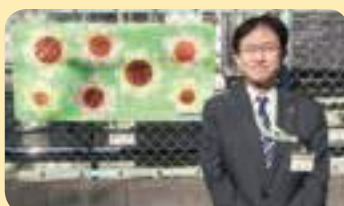
大谷場保育園ヒマワリパネルの前にて ※撮影のため、マスクをはずしています。