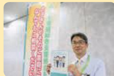
子ども家庭総合支援拠点の前にて