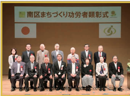
南部・武蔵浦和・西浦和・西地区