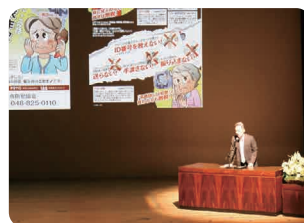
浦和警察署生活安全課