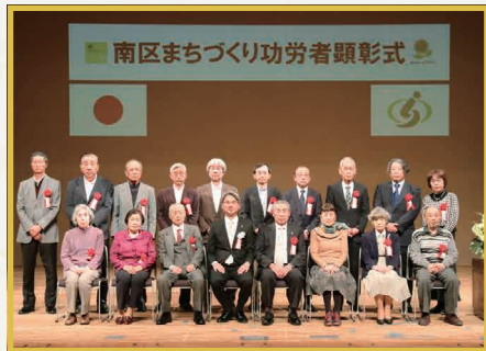
大谷場・谷田・大谷口地区

区内で地域活動に尽力されている自治会の役員に敬意を表し、その功績を讃えるため、2月17日（土）にさいたま市文化センターで開催し、被顕彰者36名へ区長から感謝状と記念品を贈呈しました。