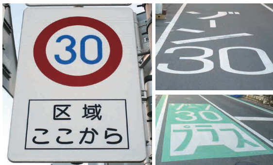
ゾーン30・ゾーン30プラス区域入口にある標識や路面標示

春の全国交通安全運動が、4月6日(出)から15日(月)まで、実施されます。この機会に、南区内の『ゾーン30』、『ゾーン30プラス』地域を確認し、交通事故防止にご協力をお願いします。