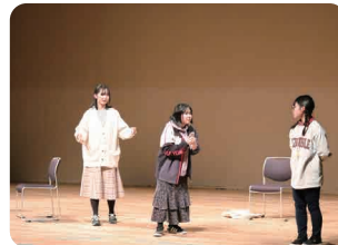
浦和実業学園高等学校演劇部