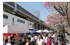
前回の様子(令和元年度)