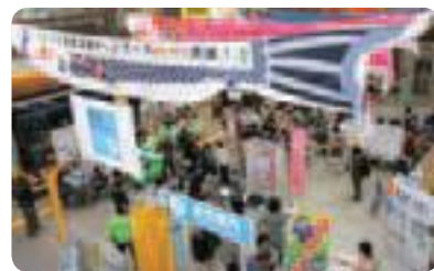
▲前回の見沼区市民活動ネットワークまつりの様子