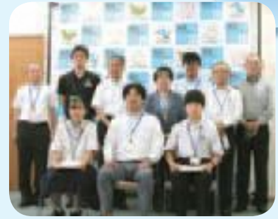
▲民生委員の方々、子ども民生委員の生徒さんと