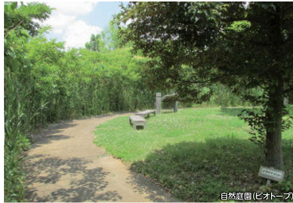
自然庭園(ビオトープ)

圓蔵院の境内には、市の指定文化財(天然記念物)のシダレザクラと大イチョウがあり、訪れる人を魅了します。また、上山口新田の田んぼは、野の花や水辺の生き物の宝庫です。