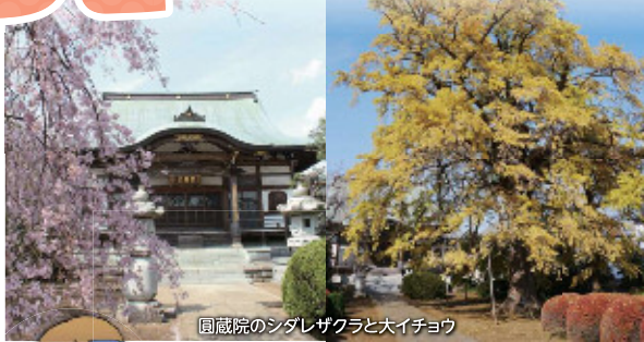
圓蔵院のシダレザクラと大イチョウ