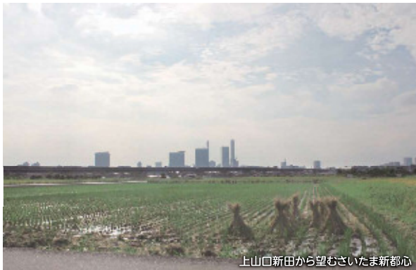
上山口新田から望むさいたま新都心

体力に余裕があれば、さいたま新都心駅から歩いてみるのもおすすめです。小松台バス停で、大宮方面に戻ることができます。