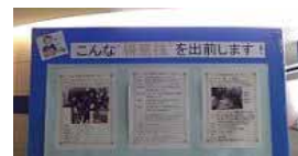
パネルイメージ (市民活動サポートセンターの事例)