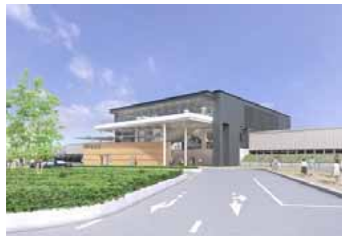
北口完成イメージ図