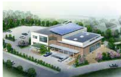
完成イメージ図 (基本設計時点)

編集・発行 〒331-8587 さいたま市西区指扇3743 さいたま市西区役所区民生活部総務課 電話:048-620-2613 FAX:048-620-2760