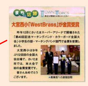
区民から寄せられた身近な情報や話題の発信