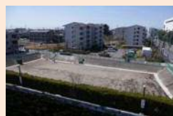
平成25年3月に完成した「西文ひろば」