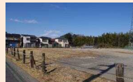
平成25年度整備予定の土屋地内予定地

「区長マニフェスト」は、区長が、まちづくりの方向性や区役所窓口の改善などの区政運営に関する考え方と、その取組をまとめ、毎年度、区民の皆様に公表するものです。