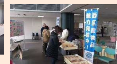
パンやクッキーなどの販売の様子