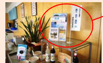
区内の情報を発信してくれる「西区魅力発信協力店」の募集