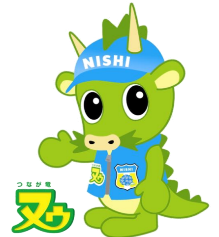
さいたま市PRキャラクター