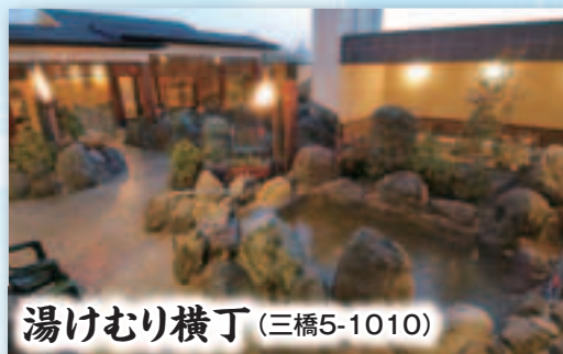
湯けむり横丁 (三橋5-1010)

開館時間 ● 平日…10時～25時 土・日・祝日…9時～25時 料 金 ● 平日…大人700円、子ども350円 土・日・祝日…大人800円、子ども400円 連絡先 ● ☎625・7373 ㊟625・7383