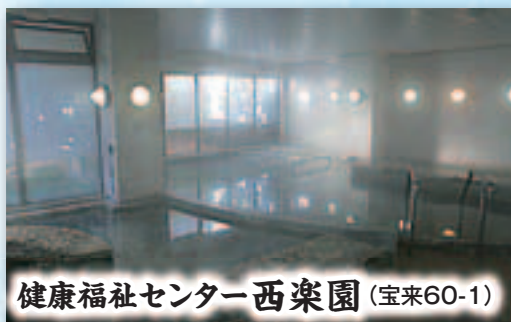
健康福祉センター西楽園 (宝来60-1)

西区には大きなお風呂がいっぱい！ 寒い冬、遠くの温泉もいいけど、近場のお風呂でゆったりのお風呂を味わいませんか。