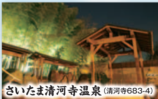
さいたま清河寺温泉 (清河寺683-4)

利用時間 ● 9時～17時 休館日 ● 月曜、祝日(敬老の日を除く)、年末年始 料 金 ● 市内居住者100円(満65歳以上は無料) 連絡先 ● ☎625・8825 ㊟625・8826