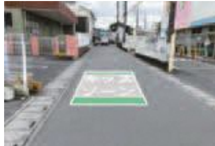
路面表示のイメージ