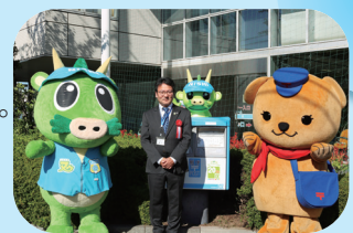
▲ラッピングポストお披露目式

また、西区役所前の郵便ポストが、区制20周年を記念したラッピングポストになっています。皆さんも年賀状やお手紙をお出しされる際は、このポストに投函してみてくださいはいかがでしょうか。