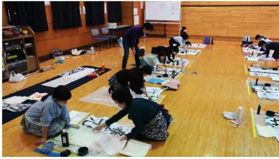
「冬休み子ども公民館/書きぞめ教室」(令和5年12月22日)