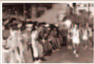
聖火リレーの様子

1964年東京オリンピック開催当時の大宮周辺の様子を伝える写真が今も残っています。試合が開始される前後の競技場周辺は、多くの観戦客や、市民などの往来により賑わっていたのではないのでしょうか。