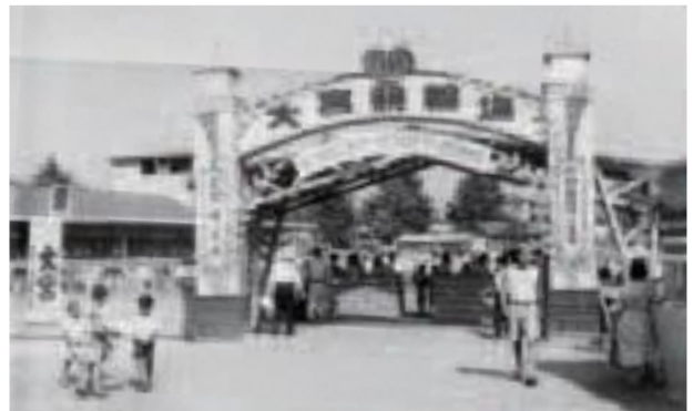
大宮公園双輪場入口(昭和26年8月)