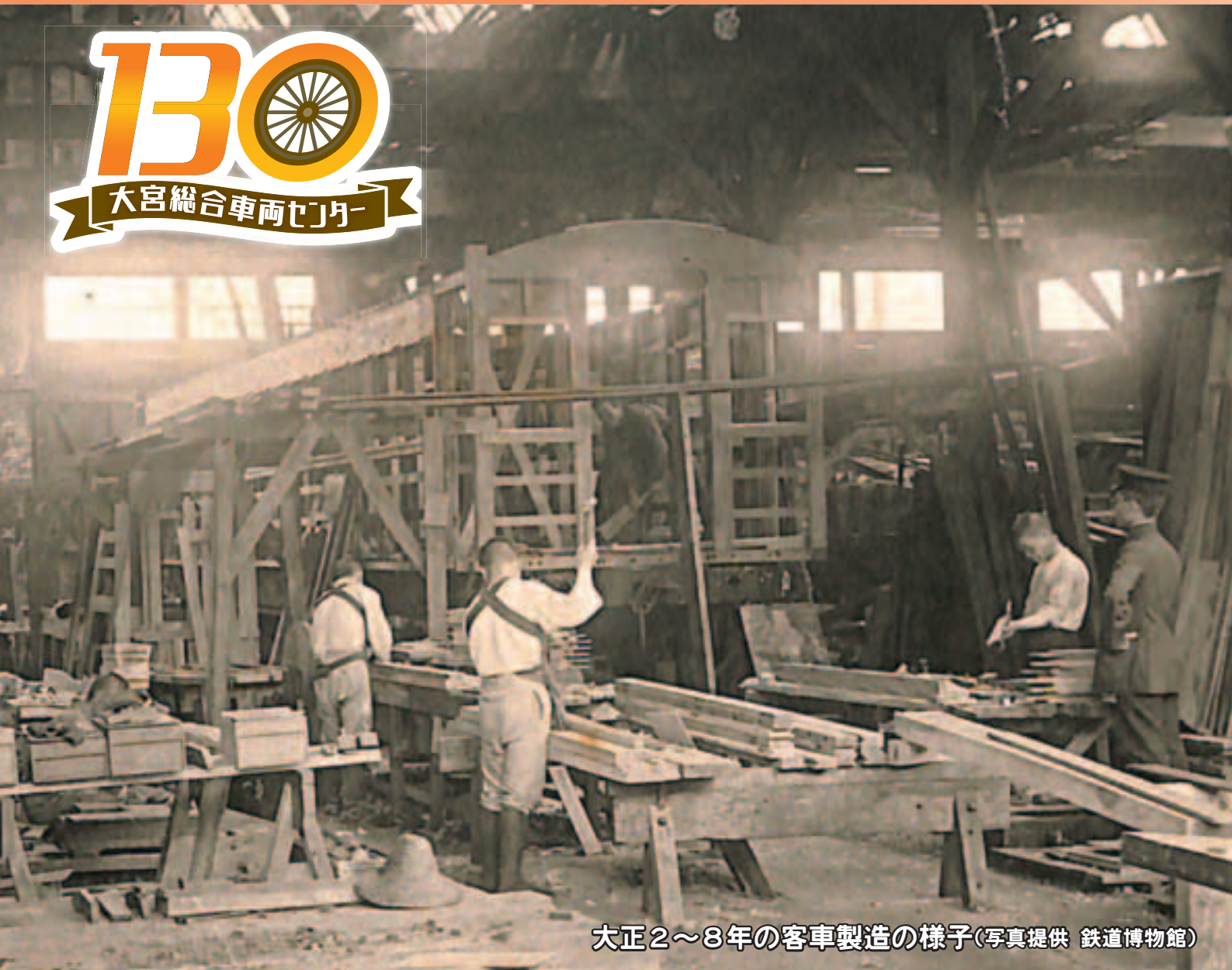
大正2～8年の客車製造の様子

鉄道開業期から大正時代までは客車の車体は木製で、その組み立ては木工場で行われていました。当時、大宮工場内には大宮駅側(現在の大栄橋側)に5つの木工場が稼働しており、その面積は合計約2,650坪(8,760㎡)、そこで働く職員は400人以上という大規模なものでした。その後、昭和初期には安全性向上のため、木製に代わり鋼製車体の客車が製造されるようになりました。