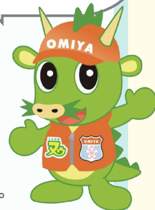
さいたま市PRキャラクター つなが竜又ウ