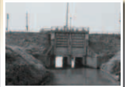
昭和水門(昭和9年完成) ▲ 写真提供 国土交通省荒川上流河川事務所