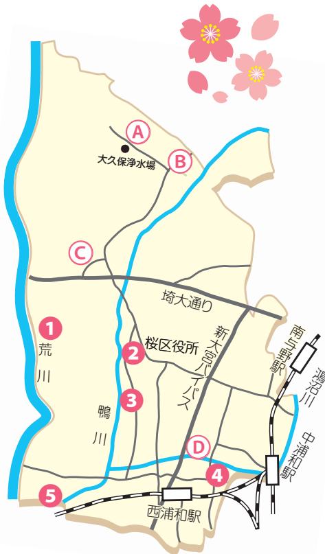
A 荒川総合運動公園通り

美しい桜を見られる場所が、桜区にはたくさんあります。お気に入りの桜スポットを見つけてみませんか。