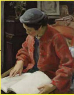
4 てらうちまんじろう 寺内萬治郎《赤いコート》 1938年 東京藝術大学蔵