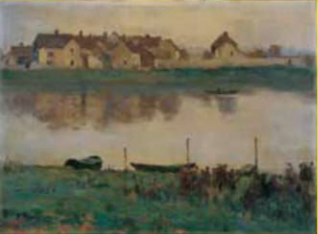
3 あのみやたか 跡見泰《ラバクル村》 1924年頃 うらわ美術館蔵