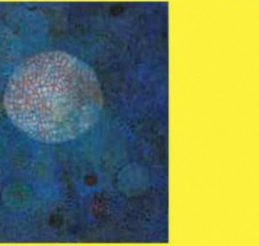
5 えいきゅう 瑛九《みづうみ》 1957年 宮崎県立美術館蔵