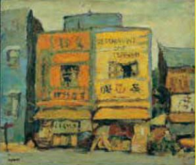
1 こまつぎくにお 小松崎邦雄《浦和東口駅前》 1947年 うらわ美術館蔵