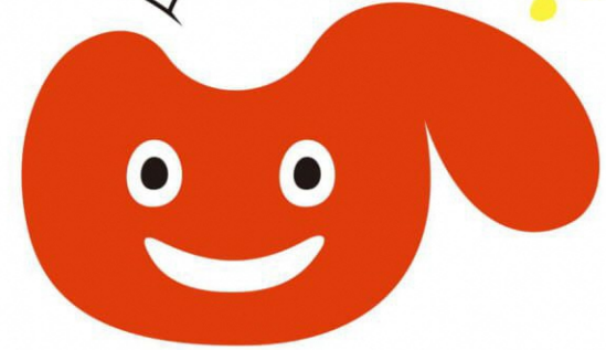
うらびい ©うらわ美術館

★作者・牧龍平さんよりアピールポイント★ みためがかわいく したしみやすい うらわのuになっている