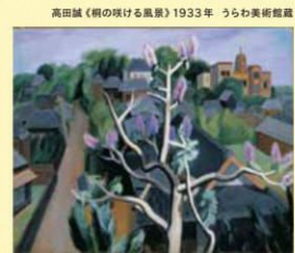
高田誠《風の吹ける風景》1933年 うらわ美術館蔵

会場 = うらわ美術館 ギャラリーA・B・C 開館時間 = 10:00-17:00 ※金曜日・土曜日は20:00(入場は開館30分前まで) 休館日 = 月曜日(ただし5月4日、8月10日は開館)、5月7日、6月22日~29日、8月11日 観覧料 = 一般830(660)円、大高生520(410)円、中学生以下無料 ※( )内は20名以上の団体料金 ※障害者手帳をお持ちの方および付き添いの方1名は半額 ※リピーター割引: 観覧済の有料観覧券の提示により、団体料金(観覧日から1年、1名、1回限り有効) ※前・後期共通チケット: 一般1,200円、大高生700円 観覧無料期間 ①開館20周年記念: 4月25日(土)~5月6日(水休) ②オリンピック・パラリンピック連携記念: 7月23日(木祝)~7月31日(金) 主催 = うらわ美術館 企画協力 = 日動美術財団