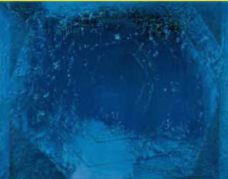
6 すぎまただし 杉全直《きっこう》 1973年 うらわ美術館蔵