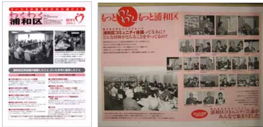
仕様：A4 版、全 8 頁、2 色印刷

浦和区民会議の活動を広く知らせるため、区民会議だより「わくわく浦和区」創刊号を平成 18 年 3 月に発行し、全戸配布しました。企画・編集は広報部会が中心となっており、区民会議の概要と委員の紹介、平成 15 年度、16 年度に市政に提案した内容、コミュニティの広場交流会の様子やコミュニティ会議の紹介などを盛り込むとともに、3 月下旬に開催されるコミュニティ会議事業「二七の市」の案内、区民会議の傍聴やコミュニティ会議結成の呼びかけなどを掲載しました。