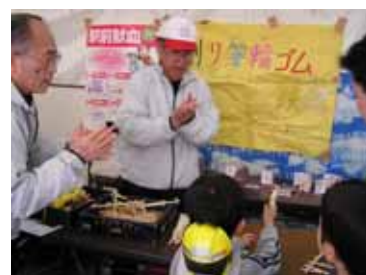
二七の市での区民会議コーナーの様子