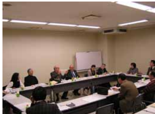
コミュニティの広場実行委員会の様子

4回の委員会と作業部会を開催するなかで、まず、交流発表会と広報啓発事業のそれぞれの具体的な内容の詰め、事業計画書の作成を行いました。また、資料作成や場内案内、受付、司会進行などの係を決めて、催しに必要となる備品等の調達、コミュニティ会議紹介冊子や式次第など配布資料の作成などを進め、開催当日は区民会議全体の協力を得て運営にあたりました。