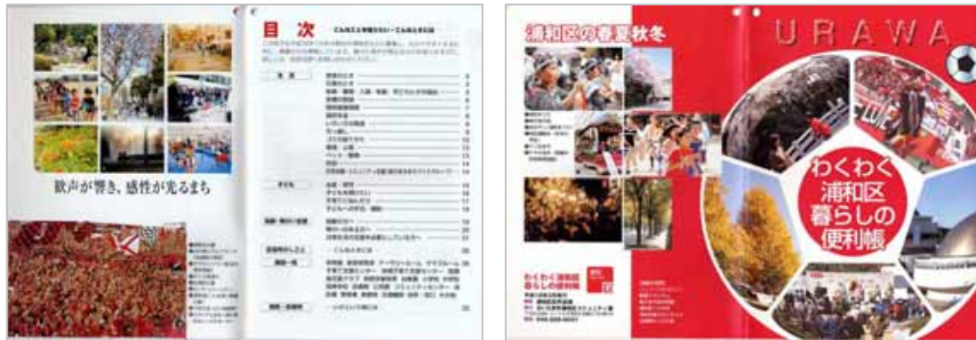
仕様：A5 版、全 36 頁、表紙 4 色、本文 2 色印刷

広報部会は、区が発行する浦和区区民便利帳の編集に携わることとなり、記載内容やデザイン・レイアウトの吟味などを区コミュニティ課・印刷会社と協議しながら、区民の暮らしに役立つ広報冊子の作成を進めました（平成 18 年 3 月発行、全戸配布）。