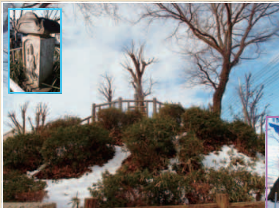
大東の富士塚と頂上にある庚申塔(浦和区大東3丁目)