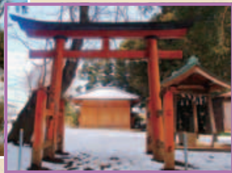
御室社(浦和区木崎5丁目)