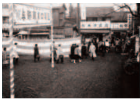
与野駅東口開設時風景

昭和33年11月に開設した東口の駅前では、紅白幕と思われる横縞の段幕から慶祝の様子がうかがえ、旧中山道に向かう人たちの足取りもまた、軽く感じられます。