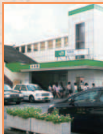
現在の与野駅東口