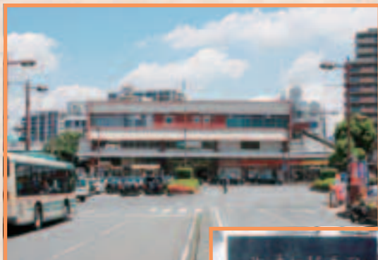
現在の北浦和駅西口

国道17号の交差点そばには北浦和駅西口開設記念碑があり、「新幹線生みの親」と呼ばれた第4代国鉄総裁 そごう しんじ きごう 十河信二氏の揮毫が刻まれています。