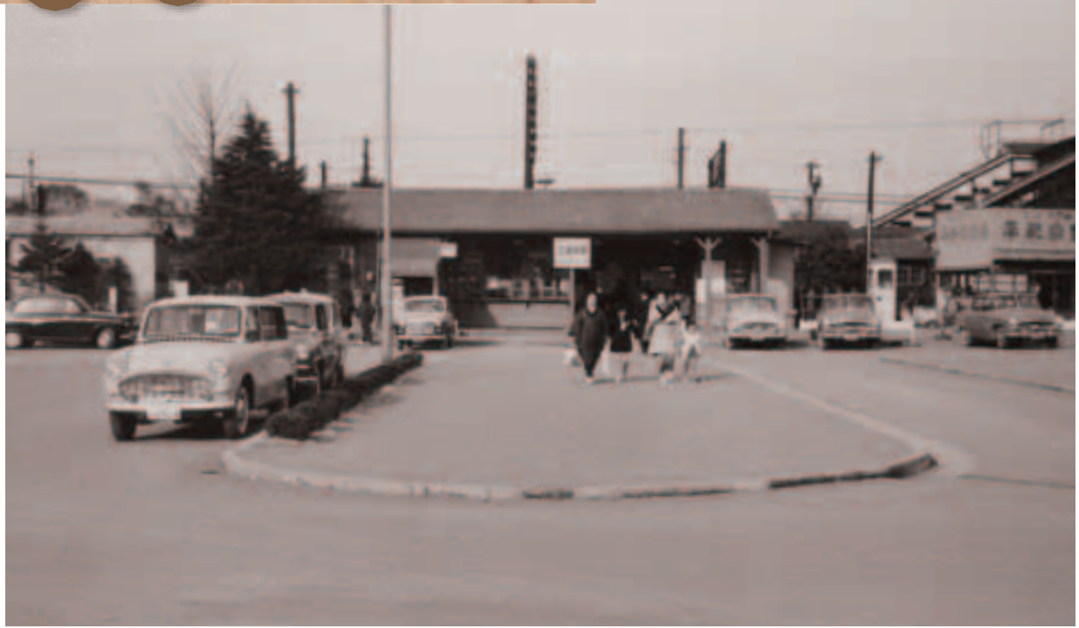
昭和35年当時の北浦和駅西口