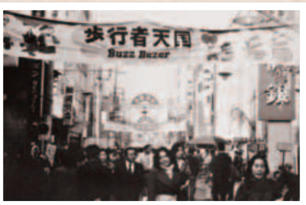
旧中山道の歩行者天国（昭和49年）