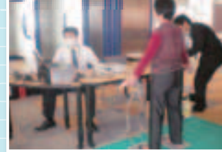
▲高齢者疑似体験 体組成測定▼