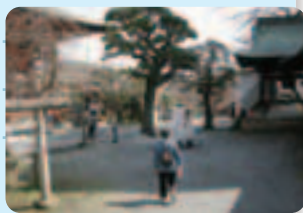
文化の小径 スタンブラリー

歴史と文化を伝える文教都市の特性を生かし、子どもたちの夢と希望を育むとともに、生涯を通じた学びの場と機会を拡充し、区民主体の生涯学習活動の振興を図ります。