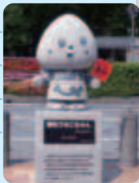
「浦和うなごちゃん」の石像

駅周辺のにぎわいを創出し、活気のある商店街の再生を図り、浦和レッズのホームタウンとして、サッカーのまちを演出し、区の魅力を向上させます。