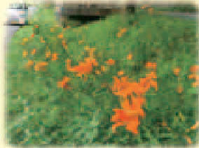
カンソウを育てる会「見沼代用水西縁に自生するヤブカンソウ」▶

● 区のホームページで、各コミュニティ会議の紹介や、浦和区コミュニティ会議認定要綱を見ることができます。