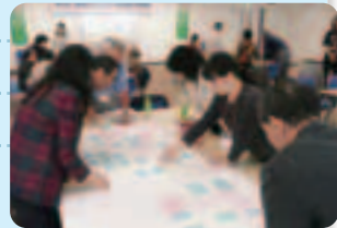
コミュニティの広場

区民の意見を反映する区民会議の充実や魅力あるまちづくりを進めるコミュニティ会議の育成支援を図り参加と協働を進展させるとともに、区の情報発信を充実させ、区民に信頼され親しまれる区役所を目指します。