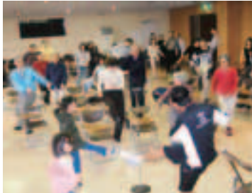
浦和レッズハートフル体操

私たちの団体は平成12年度に発足し、介護保険ミニ研修講座などを実施してきました。平成16年度、17年度には、「わくわく浦和いきいき祭り」を開催し、「まちづくり、人の輪・知恵の環・浦和の和」をモットーに、誰もが地域で“自分らしくいきいきとした老後を迎える”ことを目標に活動しています。