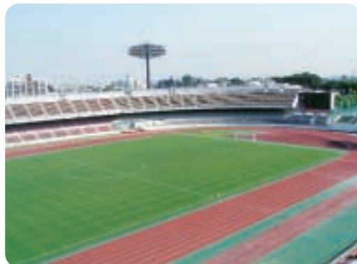
メインサッカー場（駒場スタジアム）