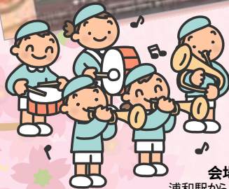
会場案内図▶ 浦和駅から徒歩10分