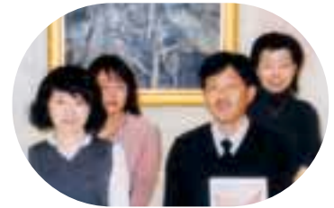
(学芸職員写真左より)

これらに加え前期、後期に分けて、コレクションの展示も行います。新収蔵品を中心に、地域ゆかりの作品、本のアートを紹介します。