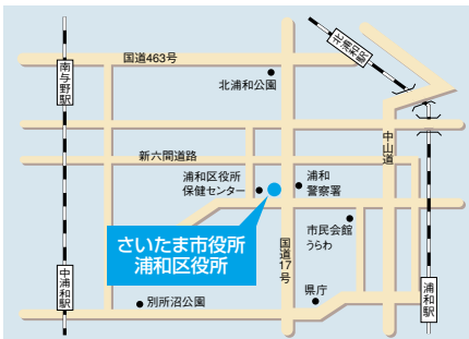
浦和区防災訓練会場

「平成15年11月29日午前9時、さいたま市域を震源とする直下型の地震が発生。地震の規模は、マグニチュード7.2と想定され、さいたま市は震度6強の揺れにみまわれた。地震による被害は甚大で、市内の至る所で道路の寸断が生じ、ライフライン等の施設にも大きな被害が及ぶと共に、建物の倒壊及び火災による多数の負傷者が発生する事態となった。」