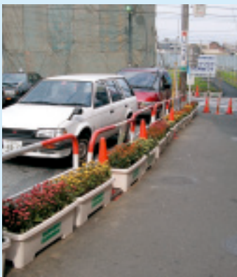
緑化プランター設置後

区では、区のまちづくり計画の策定に向けて区民意識調査を実施します。この意識調査では、身近な生活環境の問題から今後の区政運営まで、幅広く皆さんの意識、ご意見をおたずねします。区民2,000人の方（無作為抽出）に調査票をお送りしますので、調査の趣旨をご理解のうえ、ぜひご協力ください。