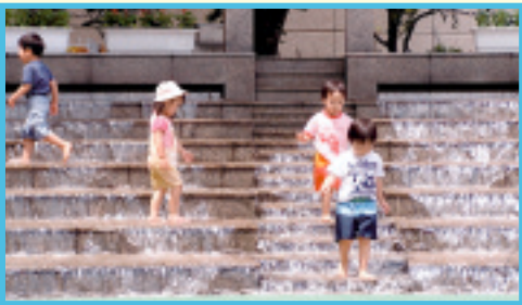
さいたま市役所東側広場(セントラルガーデン)にて 〒330-9586 浦和区常盤6-4-4 浦和区コミュニティ課「浦和区のみどころ」係