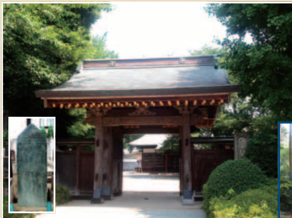
東泉寺 山門と阿弥陀三尊画像板石塔婆(浦和区瀬ヶ崎2丁目・1丁目)