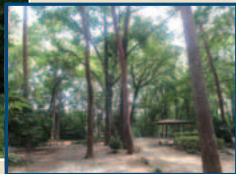
駒場緑地(浦和区駒場2丁目)