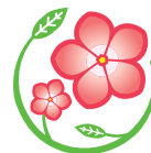
浦和区の花 ニチニチソウ

浦和区役所 浦和区常盤6丁目4番4号 ☎825・1111(代表) FAX 829・6233