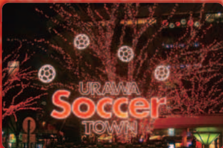
浦和駅西口周辺のイルミネーション