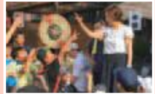
前地通り商店会 わんぱくまつりにて

秋は、芸術の秋、読書の秋、スポーツの秋などたくさんの過ごし方がありますが、私は、“食欲の秋”も楽しみたいと思っています。夏の疲れが出るこの時期は、大根やサシマなどを食べるといいそうです。皆さんも区内外で開催されるイベントに参加したり、スイーツや「浦和のうなぎ」を食したりと、秋を満喫してみたいかがででしょうか。