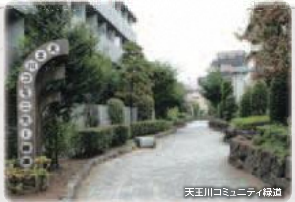
天王川コミュニティ緑道