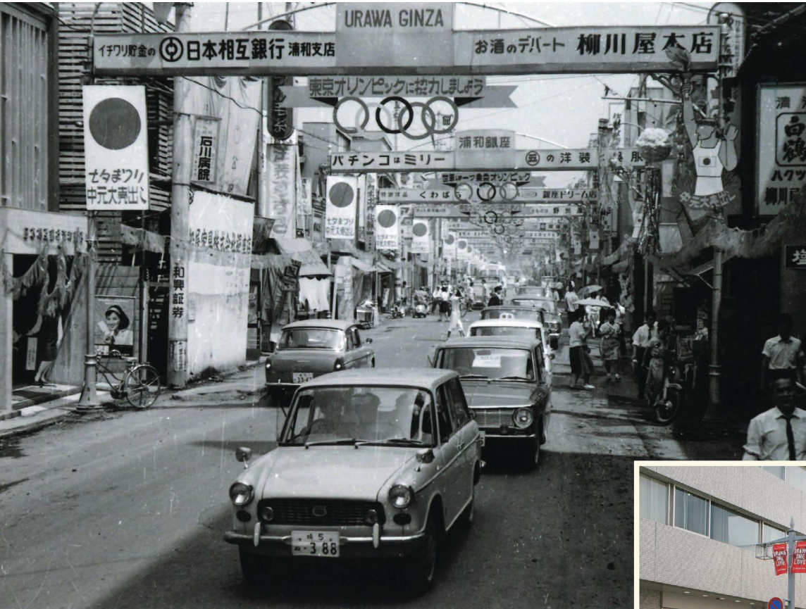
▲昭和39年頃の中山道

【新型コロナウイルスの影響により、事業内容が変更になる場合があります。詳しくは、市ホームページや各問合せ先へ。】