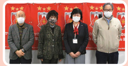
▲浦和区自治会連合会正副会長の皆さんと

浦和区長を拝命してから、早いものでまもなく1年を迎えようとしています。今年度は新型コロナウイルス感染症の影響を大きく受けながらも、「誰もが安心して暮らせるまちづくり」の実現に向け、職員一丸となって取り組んで参りました。自治会をはじめとした地域の様々な団体や区民の皆様のご協力に改めて感謝するとともに、来年度もコロナに負けないように区政運営に臨んで参りますので、引き続きご支援・ご協力のほどよろしくお願いいたします。