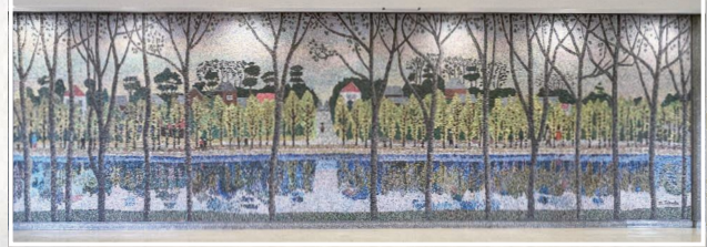
モザイク壁画(市役所)